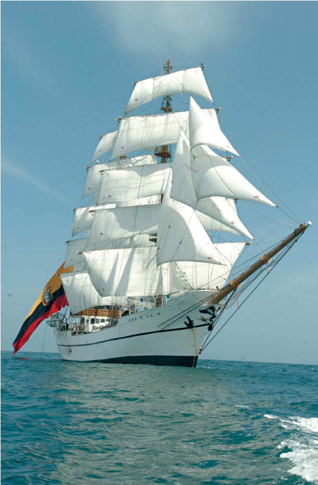
Buque Escuela "Guayas".