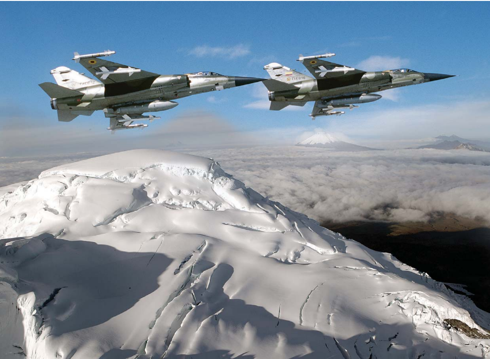
La Aviación de Combate es la fuerza principal de las operaciones aéreas.