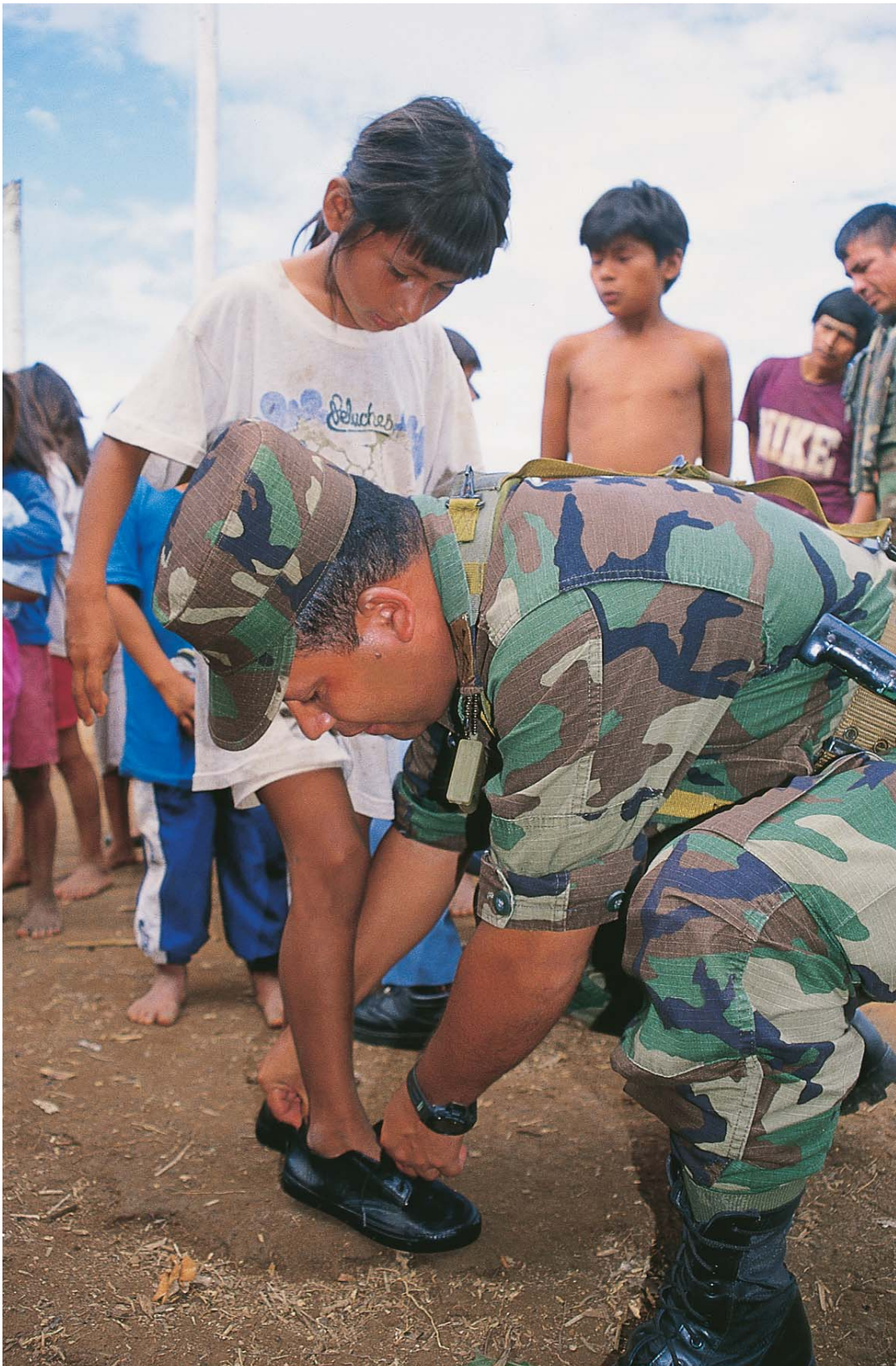
El apoyo al desarrollo se orienta a la ejecución de obras básicas de infraestructura social y de proyectos productivos de impacto inmediato, sustentables y sostenibles que permitan el mejoramiento de la calidad de vida.