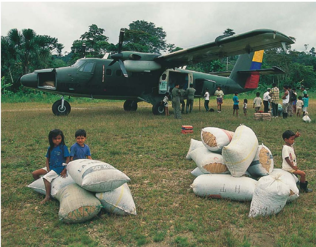
Las Fuerzas Armadas buscan apoyar el desarrollo alternativo y comunitario de las zonas fronterizas, con énfasis en la frontera norte y áreas amenazadas por la violencia, los desplazamientos y otras actividades ilícitas.

Los programas y proyectos deberán estar debidamente presupuestados, se fortalecerán los esquemas de financiamiento y no se utilizarán recursos económicos destinados a actividades operativas de las unidades militares.