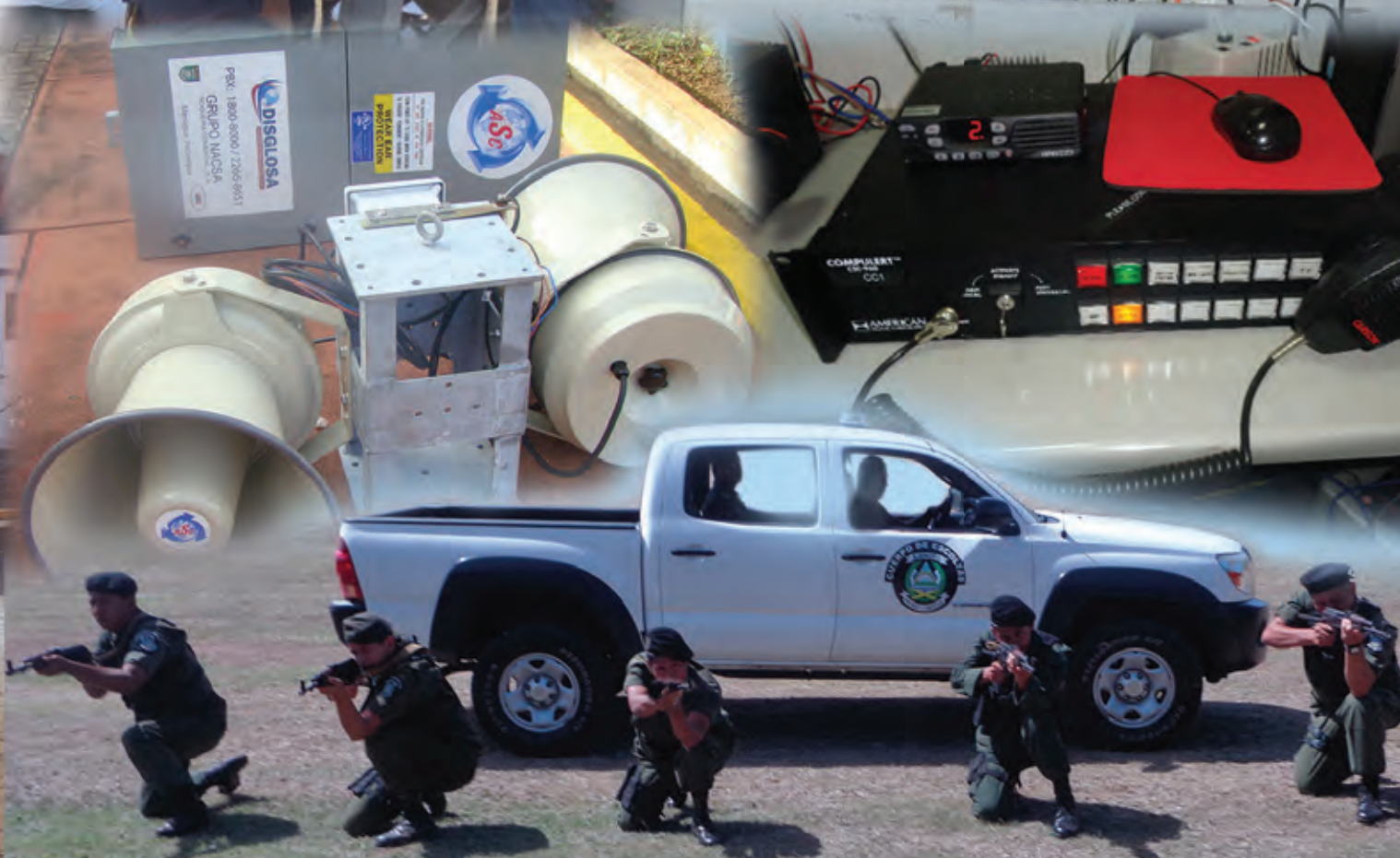
Cuerpo de Escolta "Soldado Calixto Tercero González"