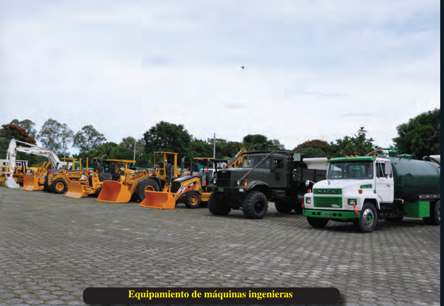
Equipamiento de máquinas ingenieras