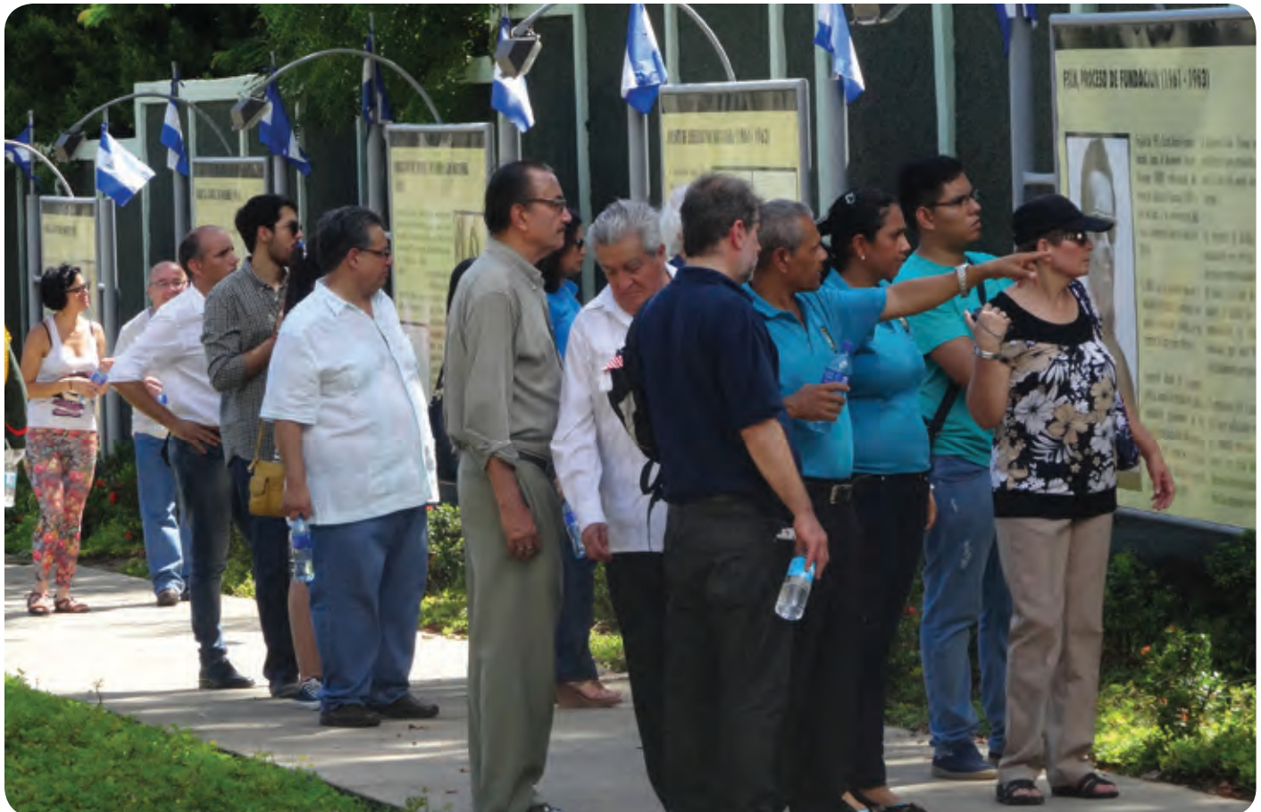
Ejército de Nicaragua

Para contribuir en el fortalecimiento de la Educación Patriótica y difusión de la historia militar de Nicaragua, se atendieron a 489 visitantes en la “Avenida Peatonal General Augusto C. Sandino”.