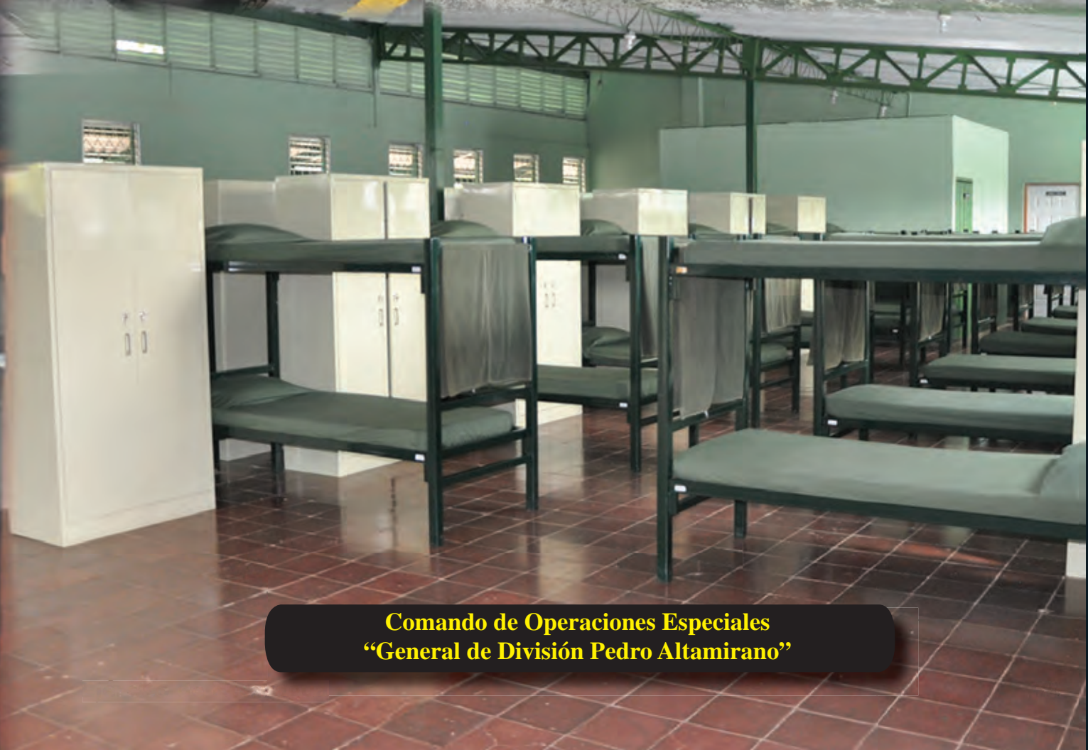
Comando de Operaciones Especiales “General de División Pedro Altamirano”