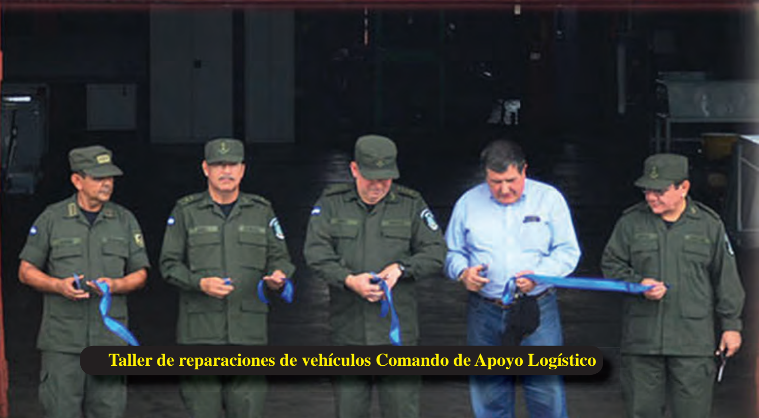
Taller de reparaciones de vehículos Comando de Apoyo Logístico