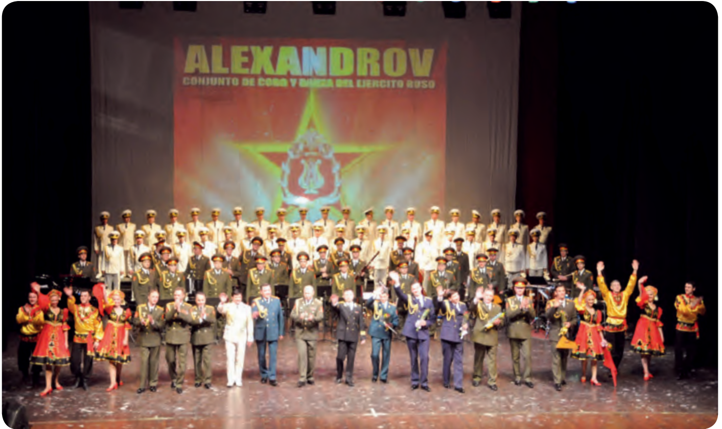
A la Gala asistieron la Comandancia General del Ejército de Nicaragua y sus señoras esposas, diputados y magistrados de los poderes de Estado, miembros del gabinete de gobierno y entes autónomos, oficiales de la Policía Nacional, Cuerpo Diplomático, Consejo Militar, oficiales superiores y personal auxiliar del Ejército de Nicaragua e invitados especiales.