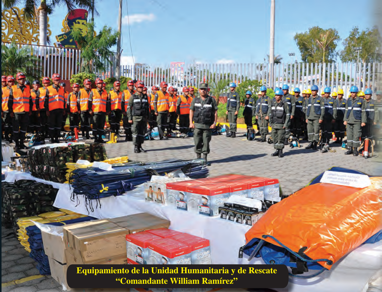
Equipamiento de la Unidad Humanitaria y de Rescate “Comandante William Ramírez”