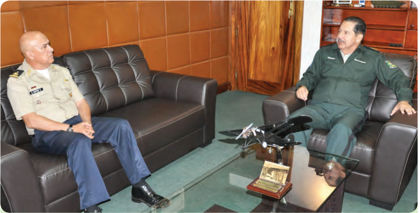
El Jefe del Estado Mayor General del Ejército de Nicaragua, Mayor General Oscar Mojica Obregón, recibió visita del Agregado Militar y Aéreo a la Embajada de los Estados Unidos Mexicanos, General Brigadier Alberto Gaitán Palo, el 6 de agosto de 2014.