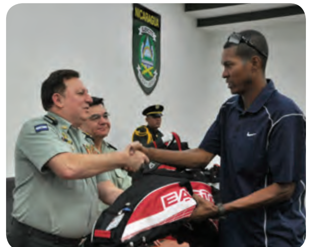
Ejército de Nicaragua

Rehabilitación del sistema de drenaje y reciclaje de la piscina olímpica del Estado Mayor General.