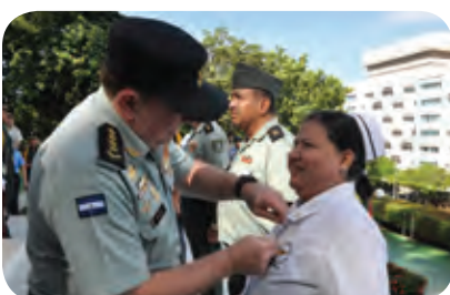
Ejército de Nicaragua