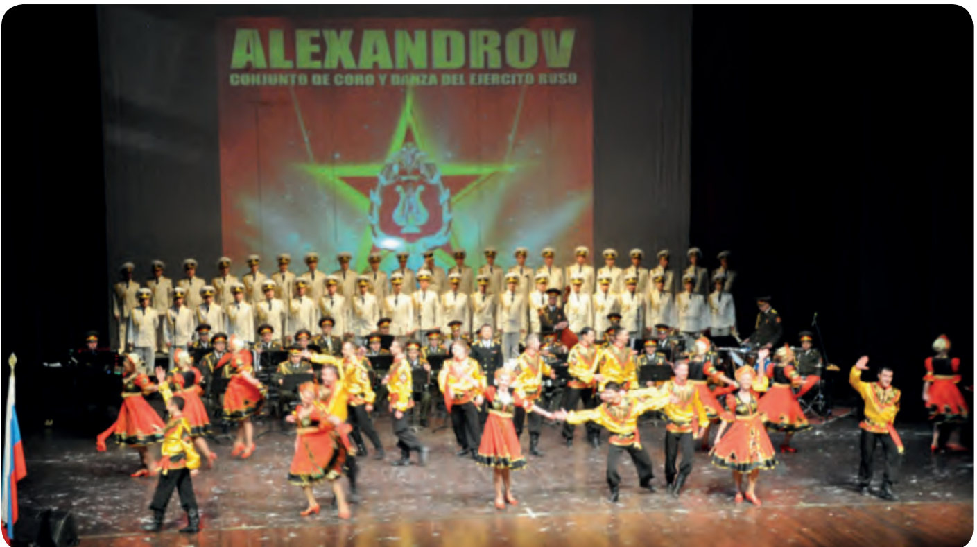
Ejército de Nicaragua

Por medio de danzas, canto y música fue representada la cultura del pueblo de Rusia e incluyeron piezas del folklore nicaragüense.