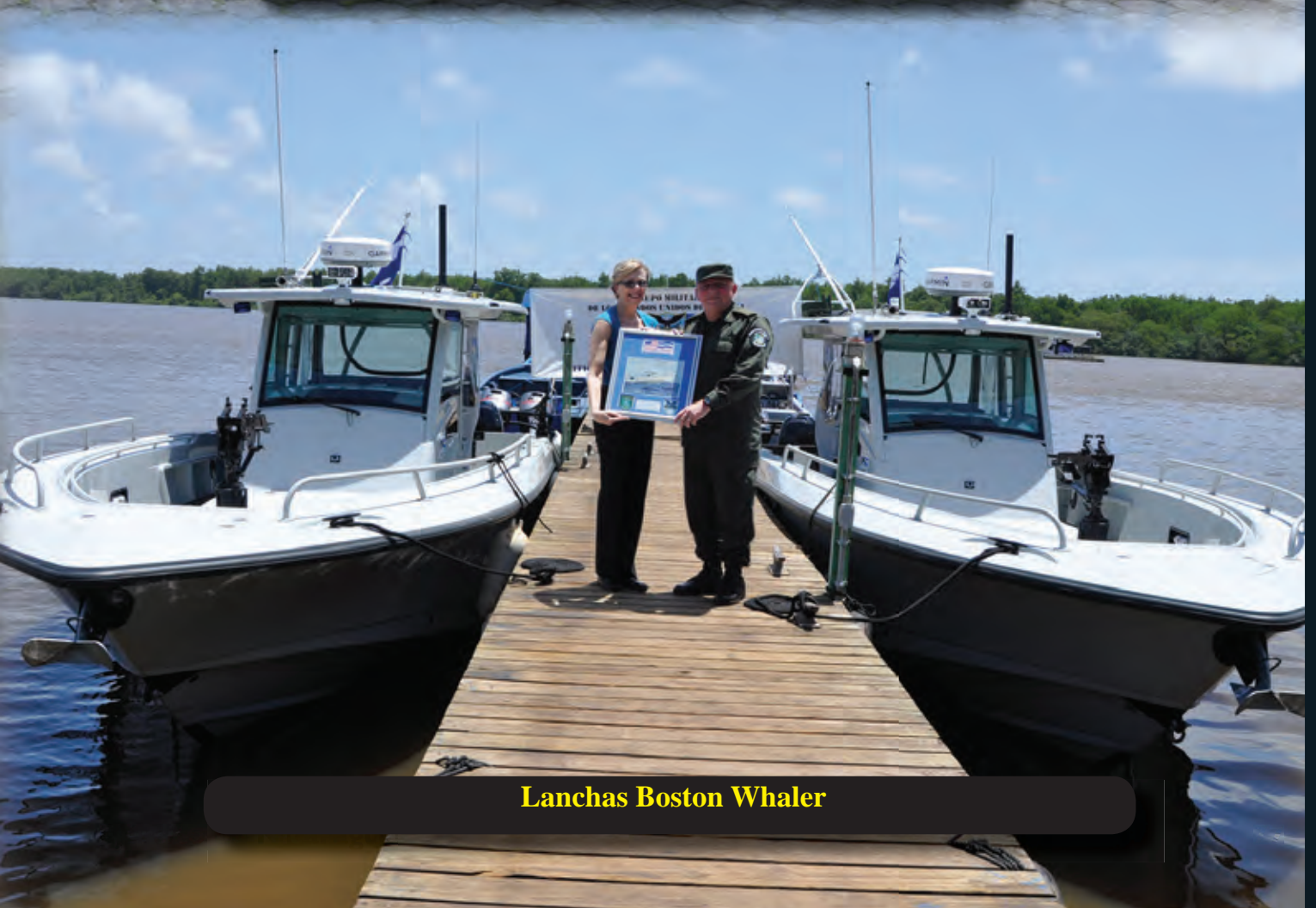
Lanchas Boston Whaler