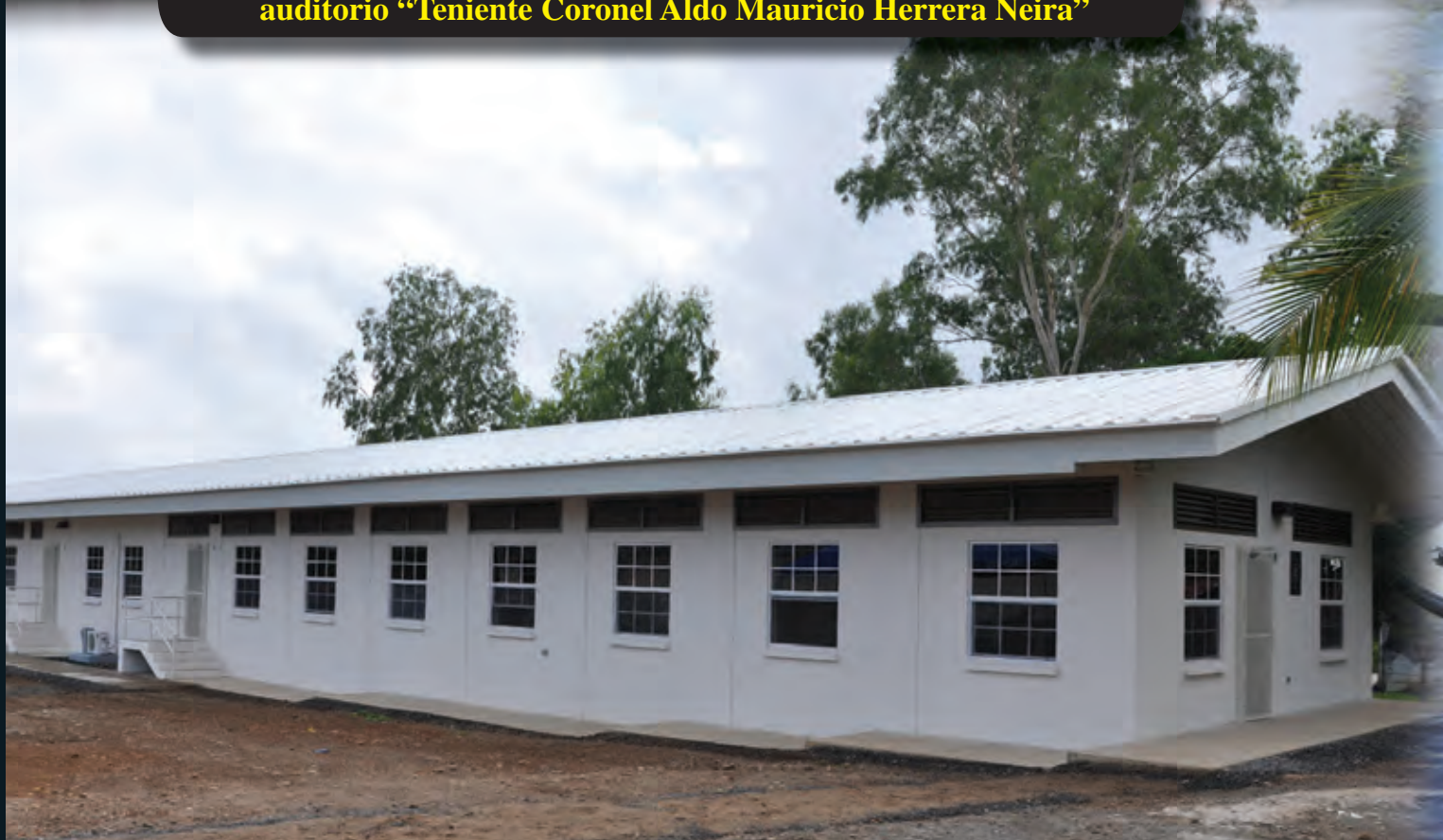
Instalaciones del Estado Mayor del Distrito Naval Caribe “General de Brigada Adolfo Cockburn”