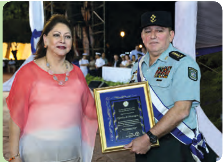
Consejo Supremo Electoral.