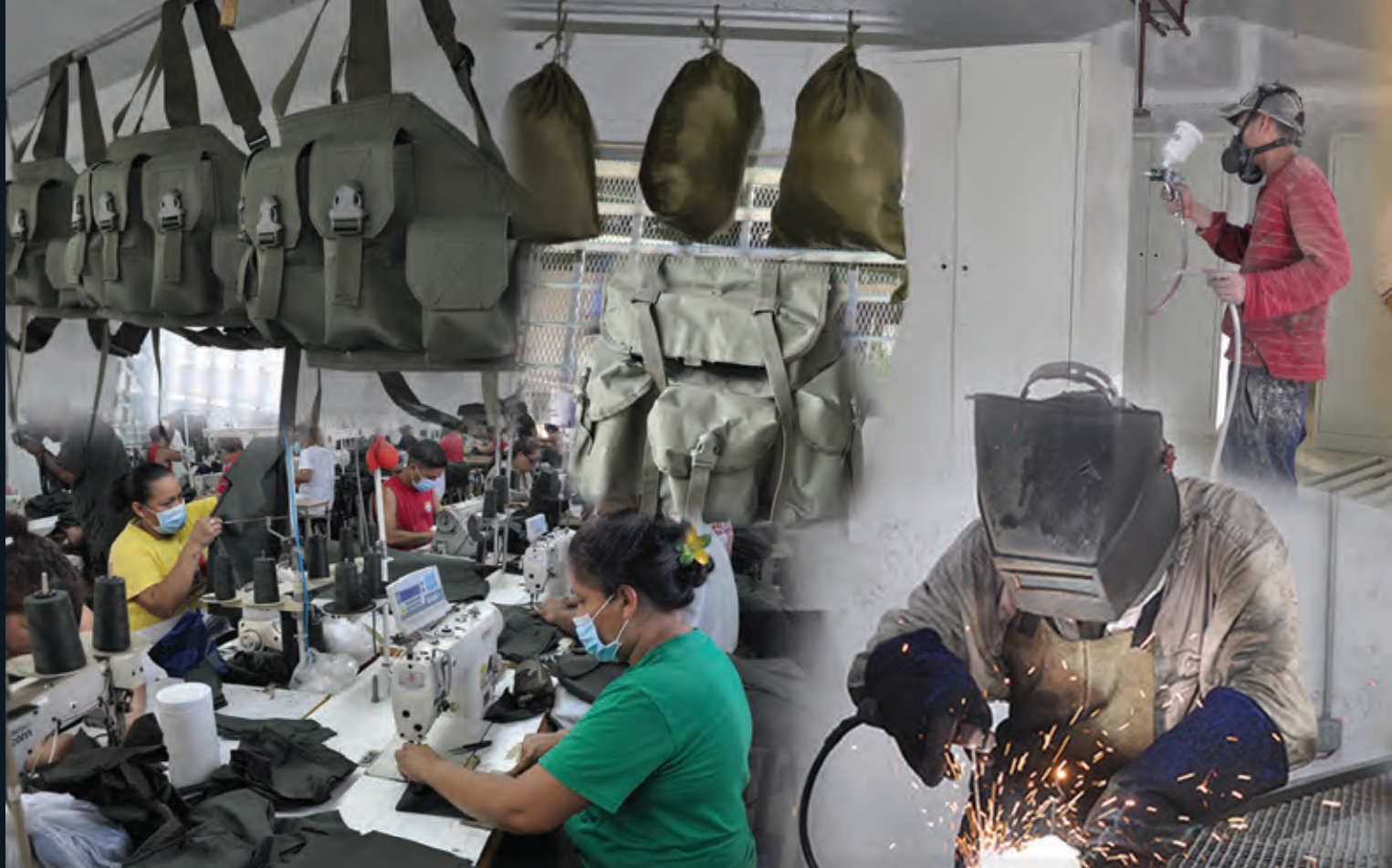
Industria Militar “Coronel Santos López”