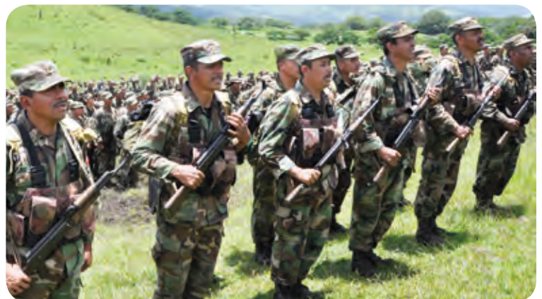
Ejército de Nicaragua

Las unidades militares con responsabilidad territorial en las zonas fronterizas, ejecutaron 102,331 actividades operativas, con la misión de impedir y contrarrestar las actividades ilícitas de fronteras como el contrabando, tráfico de inmigrantes, narcotráfico y actividades conexas, que afectan el normal desarrollo de las zonas fronterizas, como resultado de estas operaciones destacamos: la captura de 800 extranjeros indocumentados y 35 nicaragüenses por el delito de tráfico de personas.