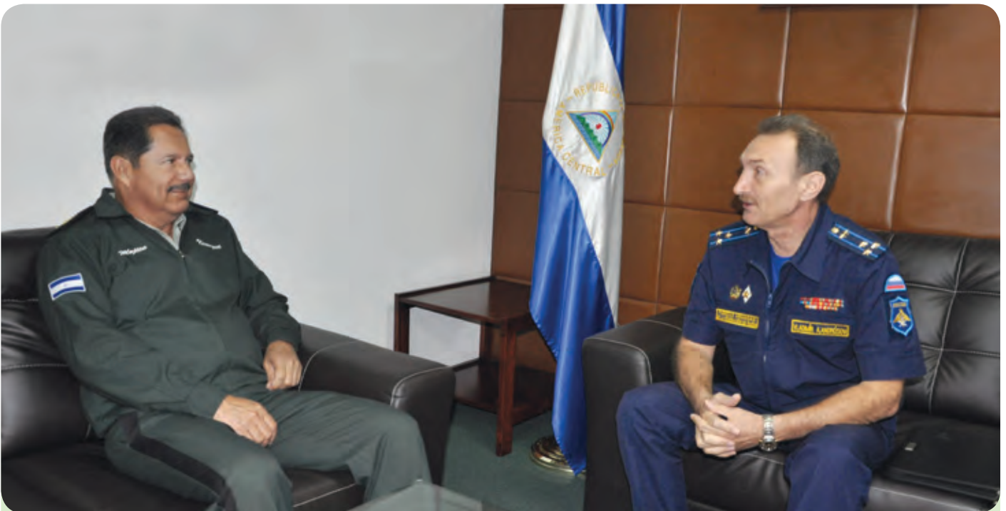
El Jefe del Estado Mayor General del Ejército de Nicaragua, Mayor General Oscar Mojica Obregón, recibió visita del Coronel Vladimir Androsov, Agregado Militar, Naval y Aéreo de la Federación de Rusia, el 6 de agosto de 2014.