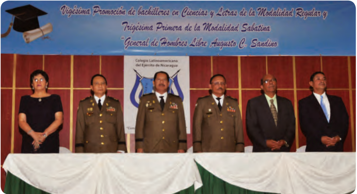
En el acto de promoción de bachilleres, dedicada al Héroe Nacional “General Augusto C. Sandino” las medallas y diplomas de Excelencia Académica y de bachiller fueron entregados por el Jefe del Estado Mayor General, Mayor General Oscar Mojica Obregón, a los 12 mejores estudiantes en reconocimiento a sus esfuerzos y al resto de bachilleres.