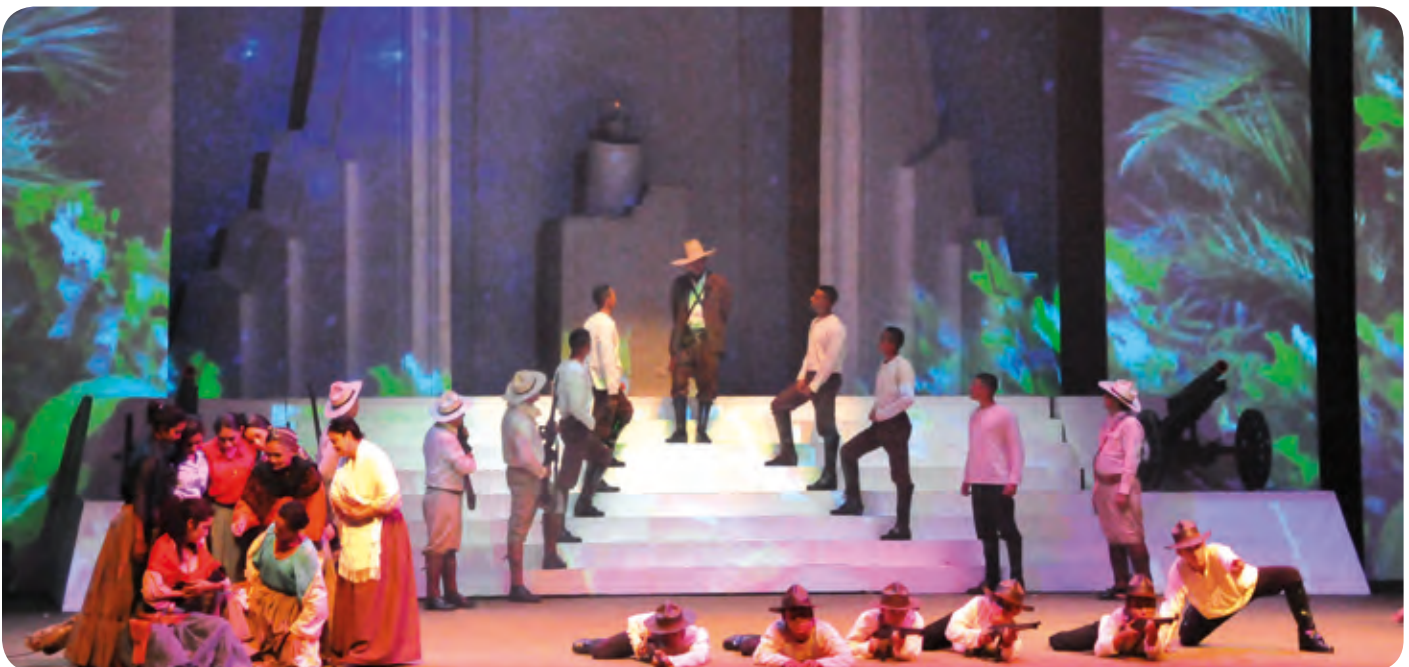
Ejército de Nicaragua

La Gala Cultural Histórica “Patria y Libertad” combinó el canto, la danza, la dramatización teatral, la interpretación musical sinfónica, la narrativa, la proyección documental, fotográfica y filmica histórica mediante la técnica novedosa del mapping, utilizada por primera vez en Nicaragua. La Gala Cultural Histórica “Patria y Libertad” fue puesta en escena en el Teatro Nacional Rubén Darío en tres ocasiones, el 29 de julio, 20 de agosto y 1 de septiembre de 2014.