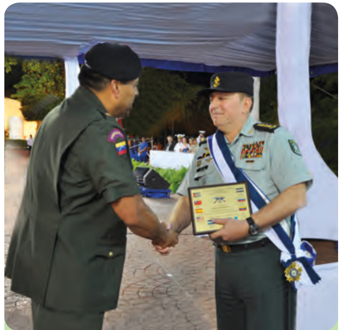
Asociación de Agregados de Defensa, Militares, Navales y Aéreos acreditados en Nicaragua.