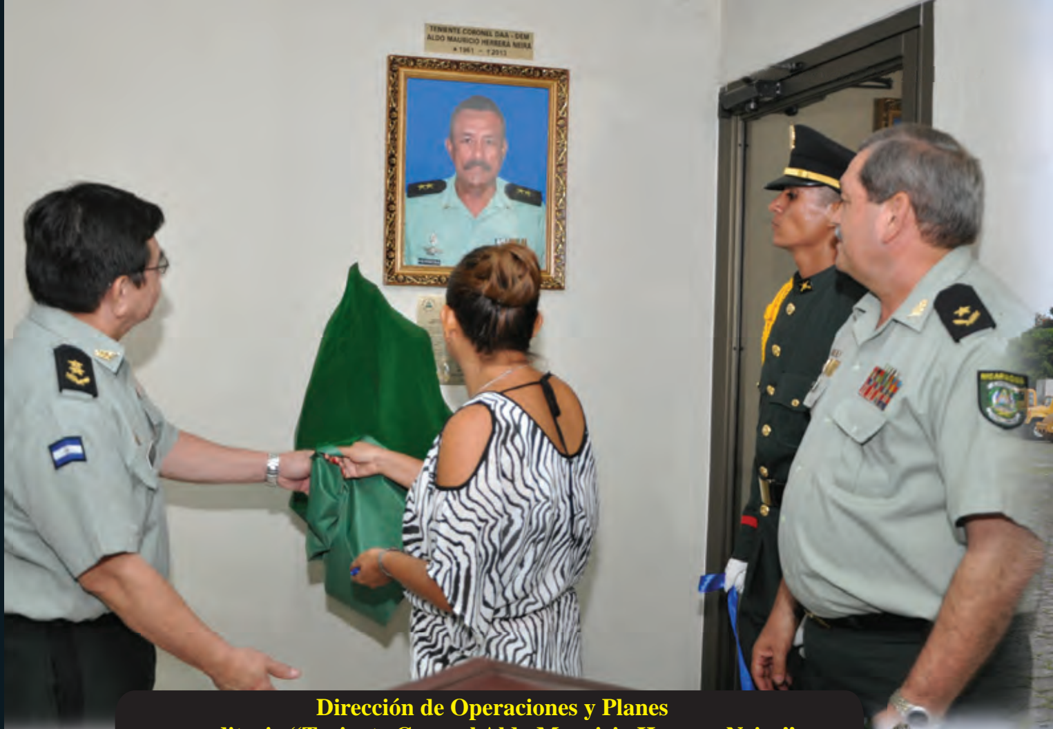
Dirección de Operaciones y Planes auditorio “Teniente Coronel Aldo Mauricio Herrera Neira”