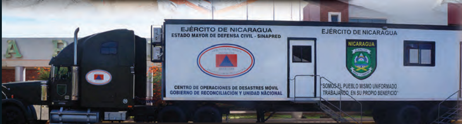
Centro de Operaciones de Desastres Móvil