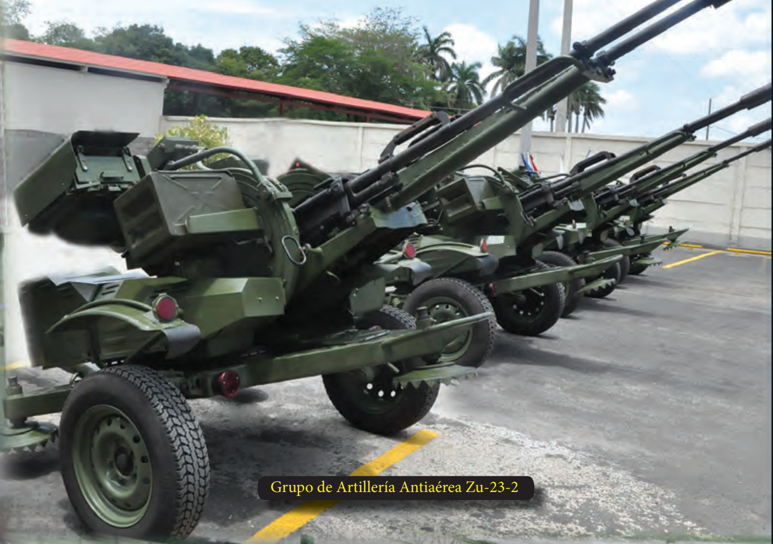
Grupo de Artillería Antiaérea Zu-23-2