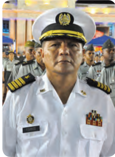
Capitán de Navío GERARDO ROBERTO FORNOS MENDOZA