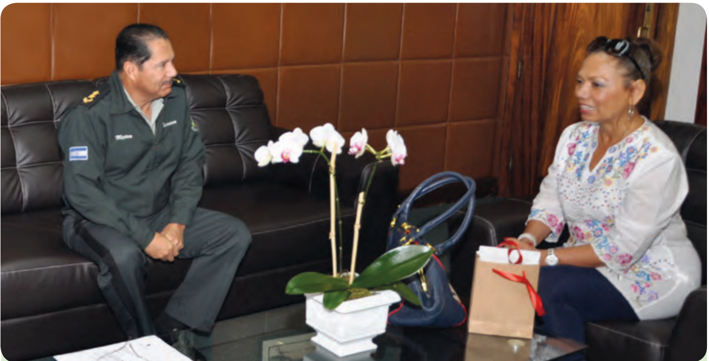
El Jefe del Estado Mayor General del Ejército de Nicaragua, Mayor General Oscar Mojica Obregón, recibió visita de la Excelentísima Embajadora Extraordinaria y Plenipotenciaria, de la República de Ecuador, señora Aminta Buenaño Rugel, el 8 de julio de 2014.