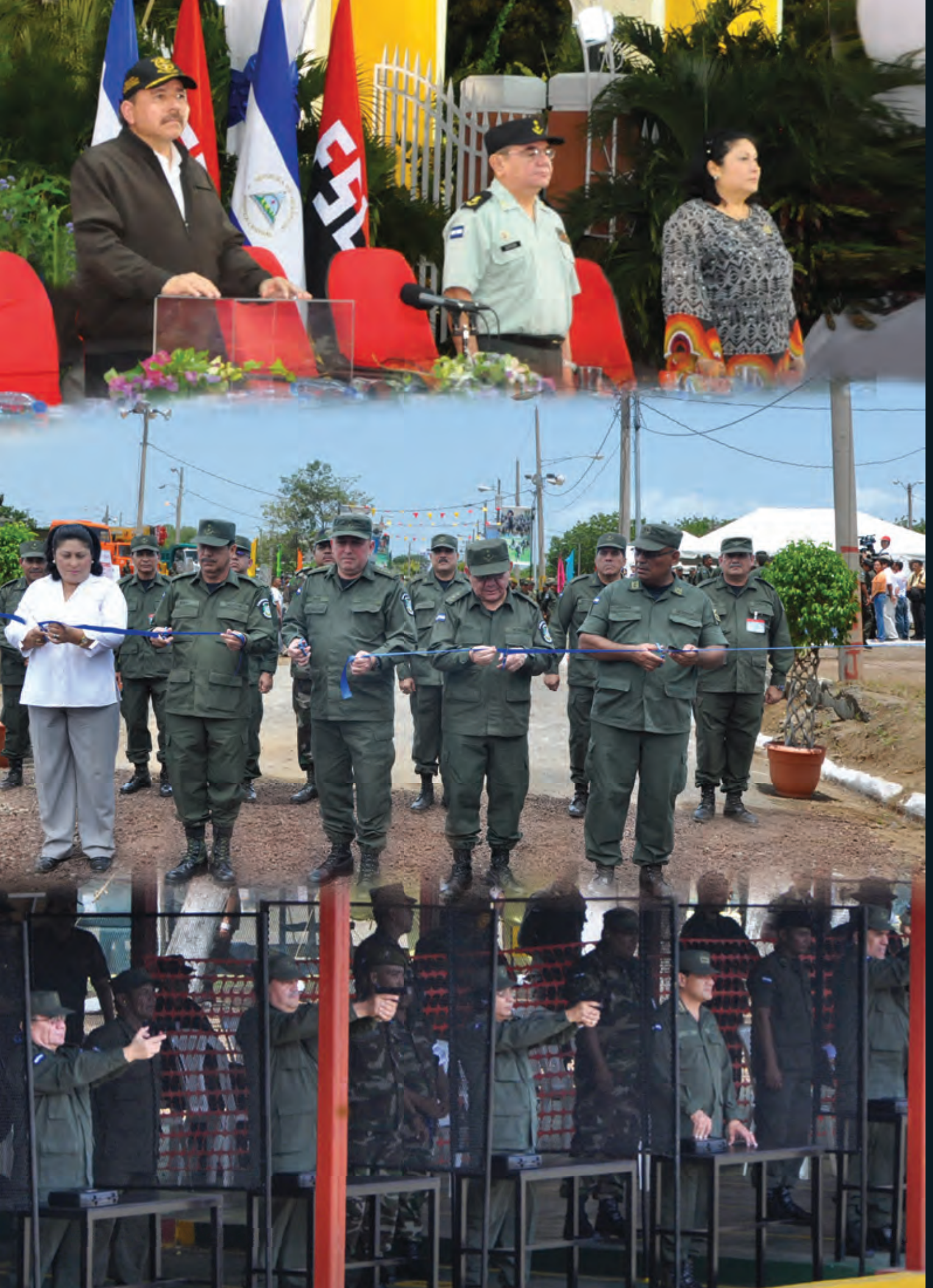
Jornada Conmemorativa del 35 Aniversario del Ejército de Nicaragua