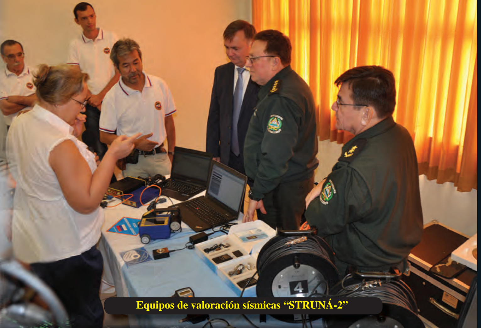
Equipos de valoración sísmicas “STRUNÁ-2”