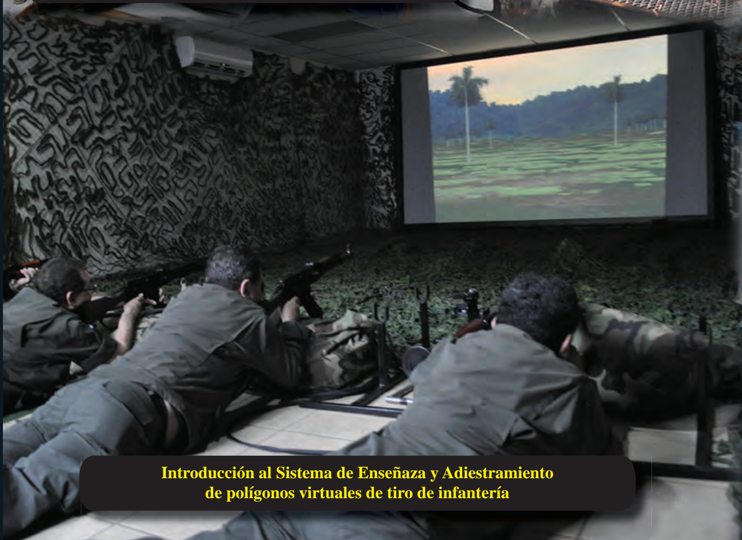
Introducción al Sistema de Enseñanza y Adiestramiento de polígonos virtuales de tiro de infantería