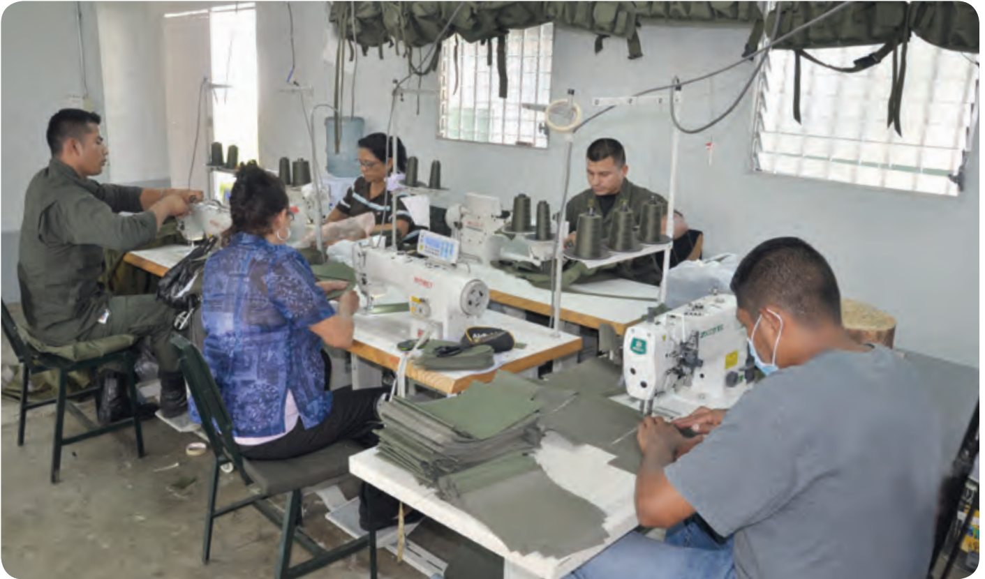
Durante el 2014 se desarrollaron nuevas líneas de producción: confección de pertrechos militares, ropa para dormitorios de tropas y fabricación de anaqueles. Se amplió el taller para la fabricación de camas y redes de enmascaramiento.