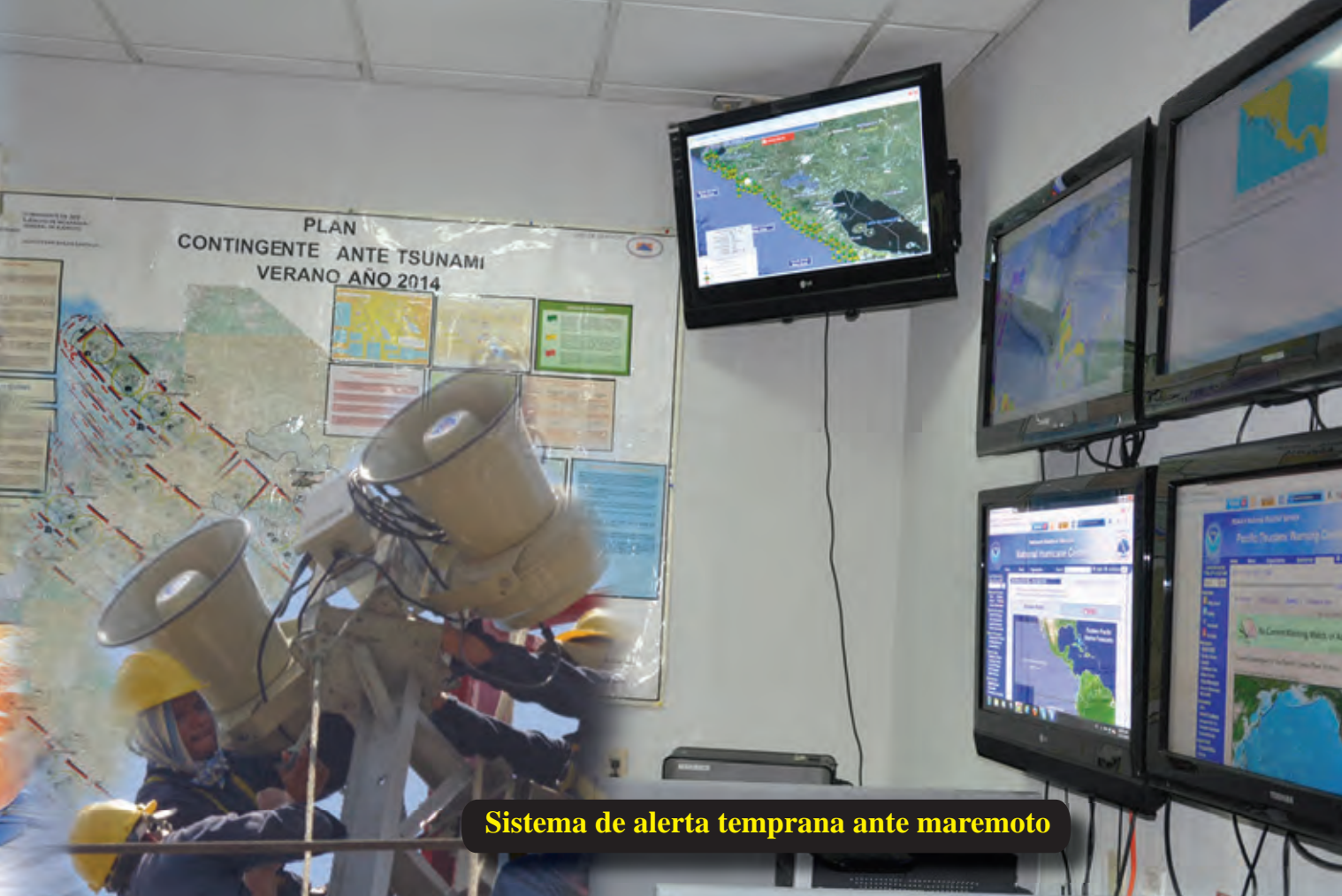
Sistema de alerta temprana ante maremoto