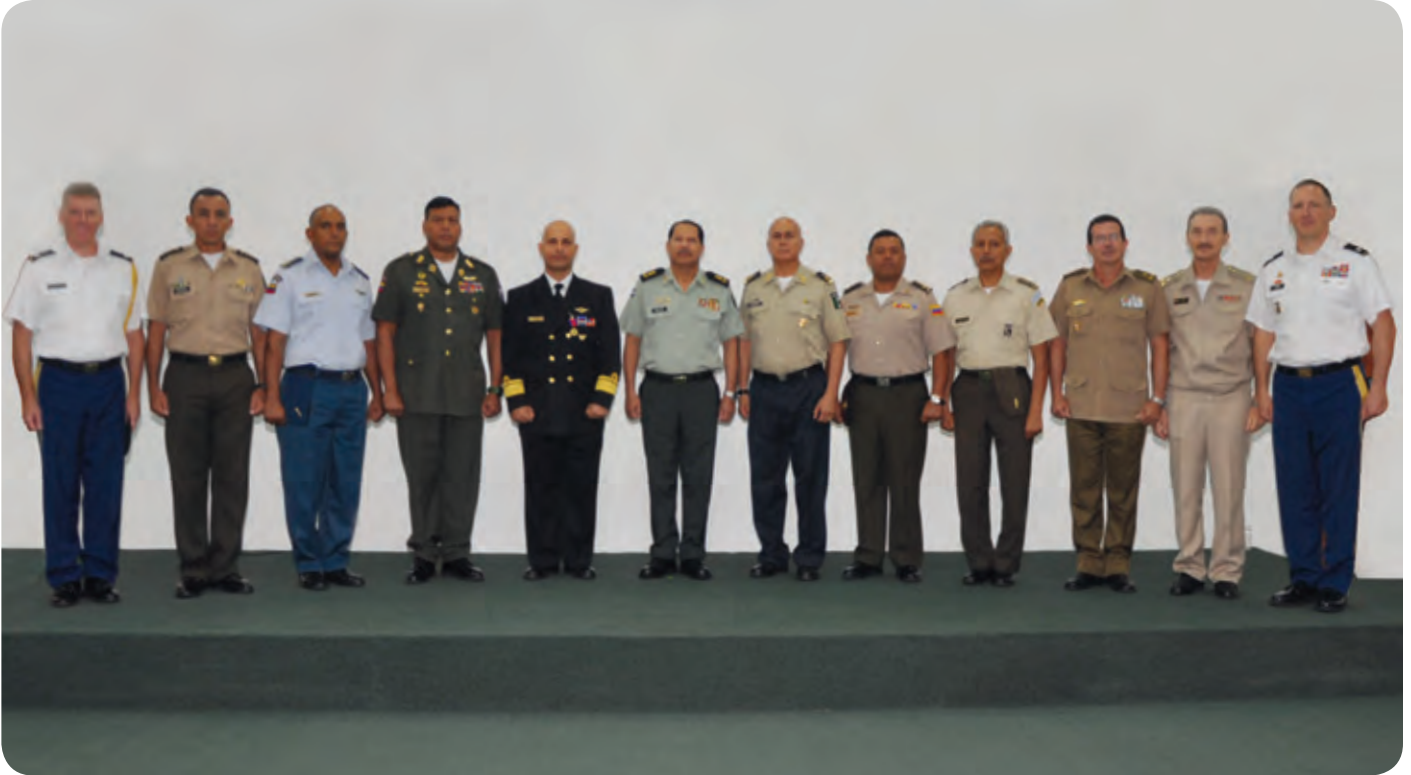
Se consolidaron los niveles de coordinación, planificación y comunicación con los Agregados de Defensa, Militares, Navales y Aéreos residentes y concurrentes y misiones militares acreditados en el país, brindándoles la atención oportuna.