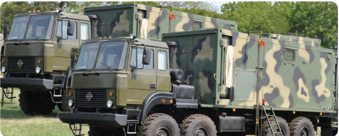
Ejército de Nicaragua

Con el apoyo de la Presidencia de la República, el Ejército de Nicaragua continua desarrollando gestiones bilaterales de cooperación internacional con países y fuerzas armadas amigas, para la modernización y desarrollo de la institución en interés del adecuado cumplimiento de las misiones y funciones asignadas por la Constitución Política de Nicaragua.