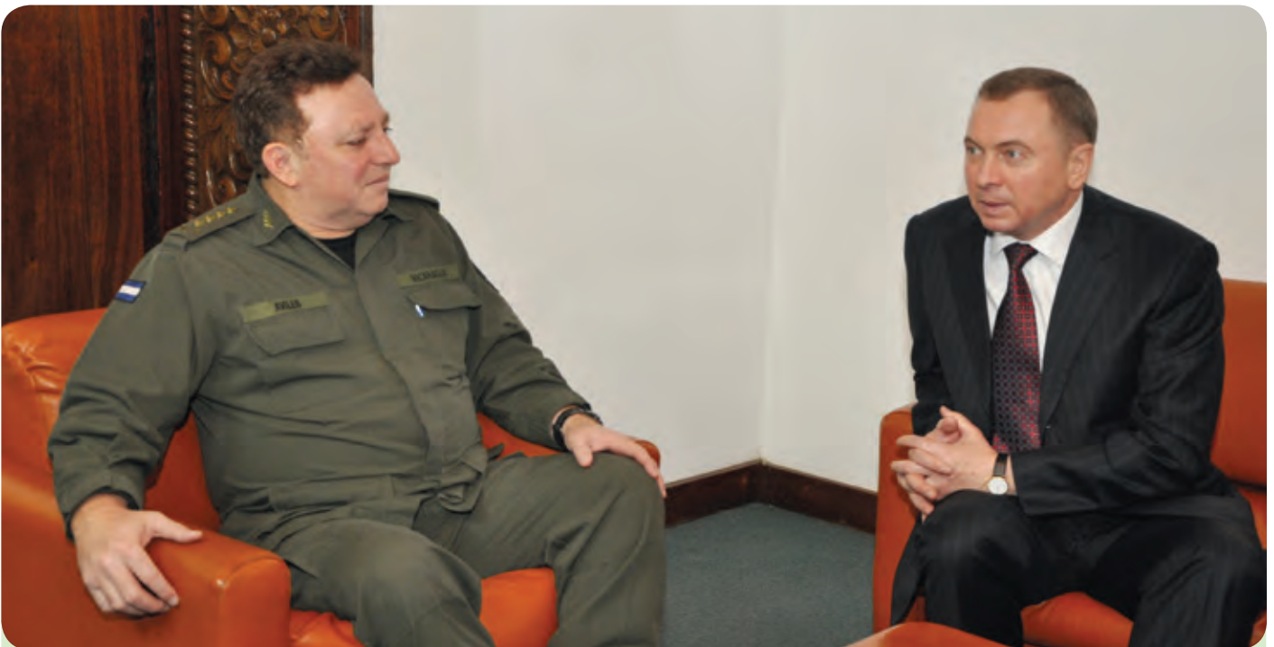
El Comandante en Jefe del Ejército de Nicaragua, General de Ejército Julio César Avilés Castillo, recibió visita del Canciller de Bielorrusia, señor Vladimir Nakey, el 19 de junio de 2014.