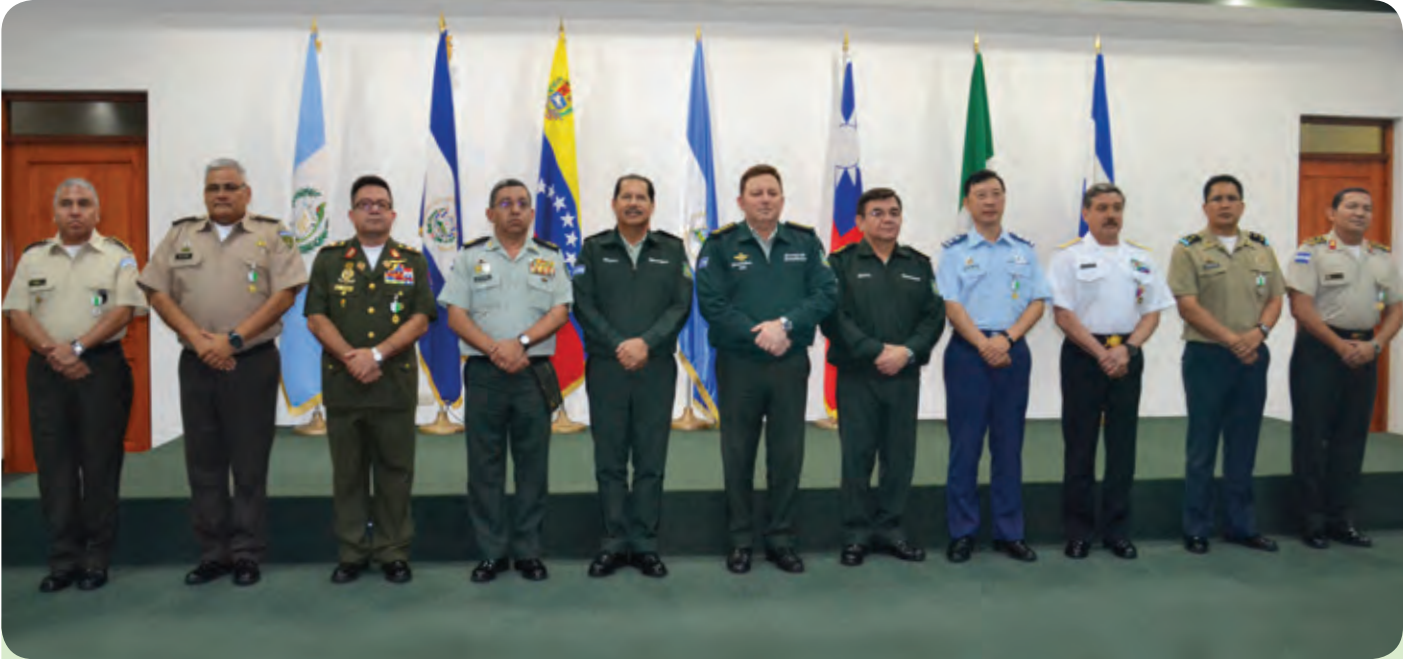
Foto oficial de la Primera Conferencia Internacional de Inteligencia Militar, presidida por la Comandancia General del Ejército de Nicaragua y los delegados de los países de los Estados Unidos Mexicanos, China (Taiwán), República Bolivariana de Venezuela, Guatemala, Honduras, El Salvador y Nicaragua.

Mesa de trabajo presidida por el Jefe del Estado Mayor General del Ejército de Nicaragua, Mayor General Oscar Mojica Obregón y la participación de las distintas delegaciones en la Primera Conferencia Internacional de Inteligencia Militar.