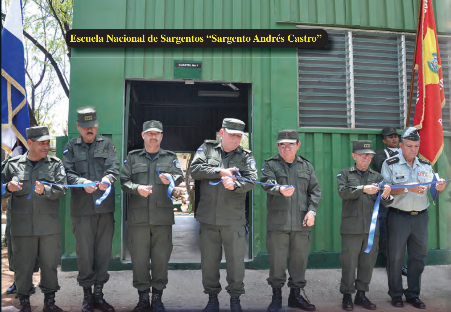
Escuela Nacional de Sargentos "Sargento Andrés Castro"