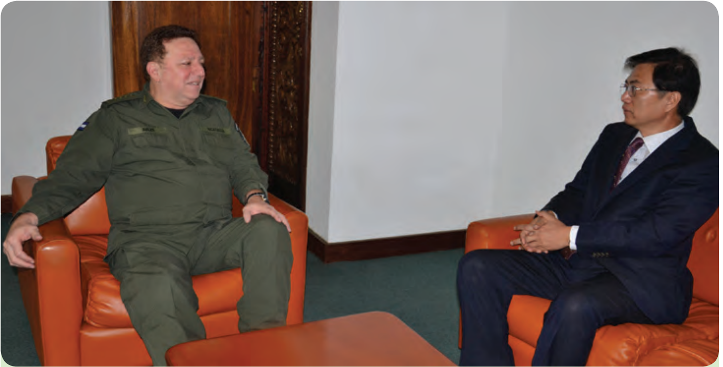
El Comandante en Jefe del Ejército de Nicaragua, General de Ejército Julio César Avilés Castillo, recibió visita del Excelentísimo Embajador Extraordinario y Plenipotenciario de la República de Corea, señor Doo-sik Kim, el 13 de junio de 2014.