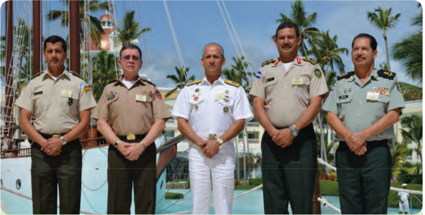
En República Dominicana, el Jefe del Estado Mayor General, Mayor General Oscar Mojica Obregón, participó en la XXX Reunión Ordinaria del Consejo Superior de la Conferencia de las Fuerzas Armadas Centroamericanas (CFAC), del 22 al 25 de julio de 2014.