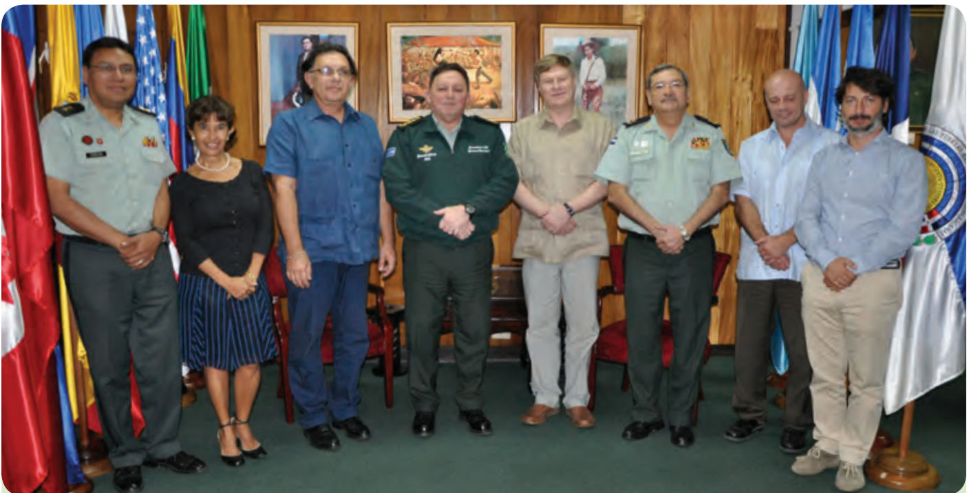
El Comandante en Jefe del Ejército de Nicaragua, General de Ejército Julio César Avilés Castillo, recibió visita del Director Ejecutivo de la Oficina de las Naciones Unidas de Servicios para Proyectos (UNOPS), el 5 de febrero de 2014.