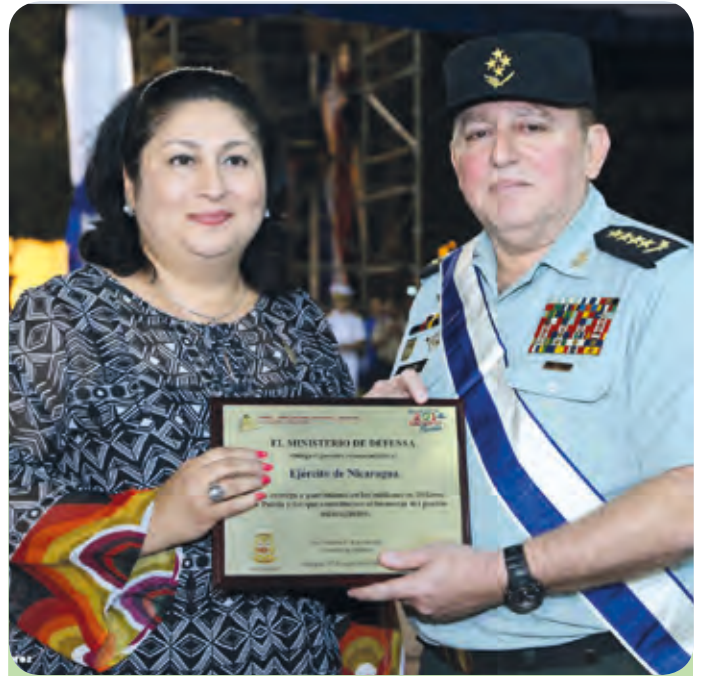
Ministerio de Defensa.