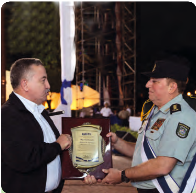
Consejo Nacional de Universidades.