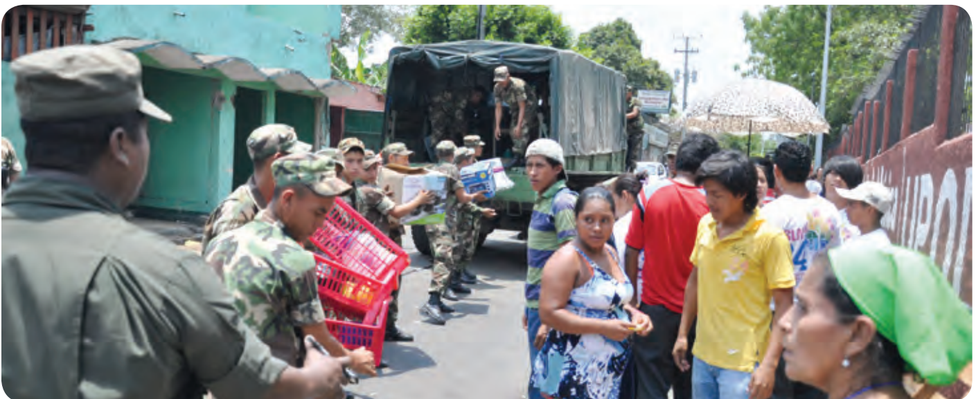
Ejército de Nicaragua

Se realizaron 17 planes de seguridad escolar, 25 brigadas locales equipadas con medios de primeros auxilios, búsqueda, salvamento, rescate y lucha contra incendios y 11 brigadas escolares equipadas con botiquines de primeros auxilios. Se llevaron a cabo ejercicios de gabinete con la participación directa de 180 funcionarios en el cumplimiento de responsabilidades administrativas propias de sus cargos ante una posible situación de emergencia o de crisis hipotética.