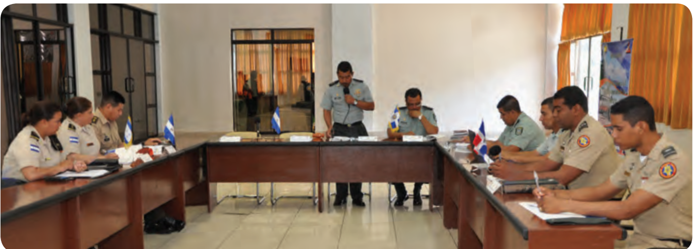
Ejército de Nicaragua