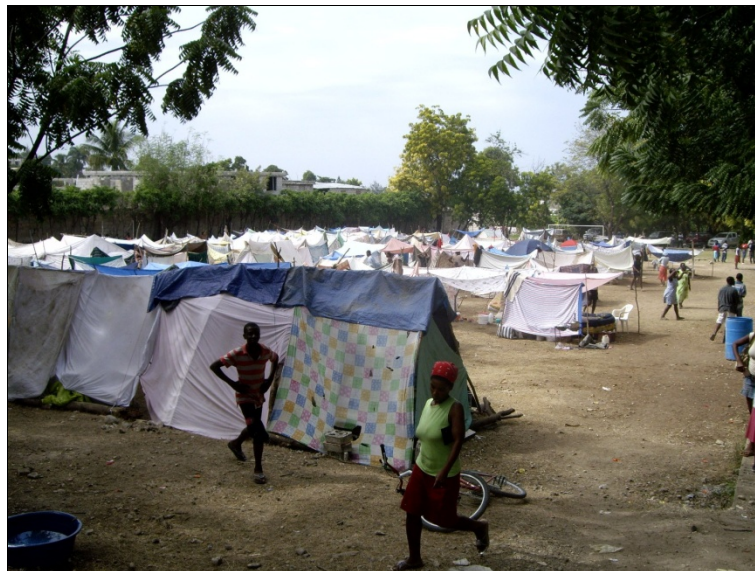
Puerto Príncipe – muchos campamentos, en diferentes grados de organización

Hay que reconocerse, sin embargo, que el esfuerzo global de ayuda a Haití aún no produjo los efectos de él esperados en toda su plenitud. Más de un millón de personas se encuentran muy precariamente acogidas en los campos de desamparados, que, conforme ya mencionado, prácticamente ocupan todos los principales espacios abiertos de la ciudad de Puerto Príncipe.