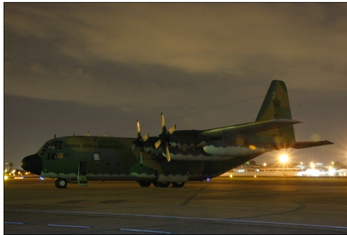
Fuerza Aérea Brasileña – cuatro aviones en el aire en régimen prácticamente continuo

En lo concerniente al poder militar, cabe registro la rápida reacción de la Fuerza Aérea Brasileña (FAB) que, incontinentemente, estableció un puente aéreo Río de Janeiro - Puerto Príncipe, sosteniendo, por algunos meses, un esfuerzo aéreo no inferior a cuatro aeronaves en vuelo todos los días, siendo dos de ida y dos de vuelta.