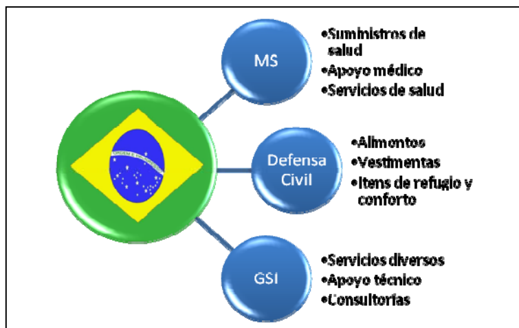
Captación de donaciones

Otra decisión fundamental fue la división de responsabilidades en la captación de las incontables donaciones que, rápidamente, comenzaron a ser presentadas, desde grandes empresas hasta modestos donantes individuales. Así, la Defensa Civil se encargó de los ofrecimientos de géneros alimenticios, vestimentas, refugios y otros ítems de confort, MS pasó a cuidar de las ofertas de apoyo médico, servicios y suplementos de salud y el GSI se envolvió con las propuestas de servicios, consultorías y otras donaciones no encuadrables en los dos primeros grupos.