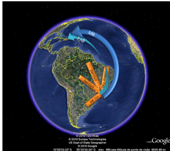
La logística de transporte

Otra decisión fundamental fue la división de responsabilidades en la captación de las incontables donaciones que, rápidamente, comenzaron a ser presentadas, desde grandes empresas hasta modestos donantes individuales. Así, la Defensa Civil se encargó de los ofrecimientos de géneros alimenticios, vestimentas, refugios y otros ítems de confort, MS pasó a cuidar de las ofertas de apoyo médico, servicios y suplementos de salud y el GSI se envolvió con las propuestas de servicios, consultorías y otras donaciones no encuadrables en los dos primeros grupos.