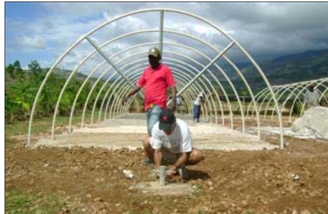
Apoyo técnico para la recuperación de la agricultura

Hay que reconocerse, sin embargo, que el esfuerzo global de ayuda a Haití aún no produjo los efectos de él esperados en toda su plenitud. Más de un millón de personas se encuentran muy precariamente acogidas en los campos de desamparados, que, conforme ya mencionado, prácticamente ocupan todos los principales espacios abiertos de la ciudad de Puerto Príncipe.