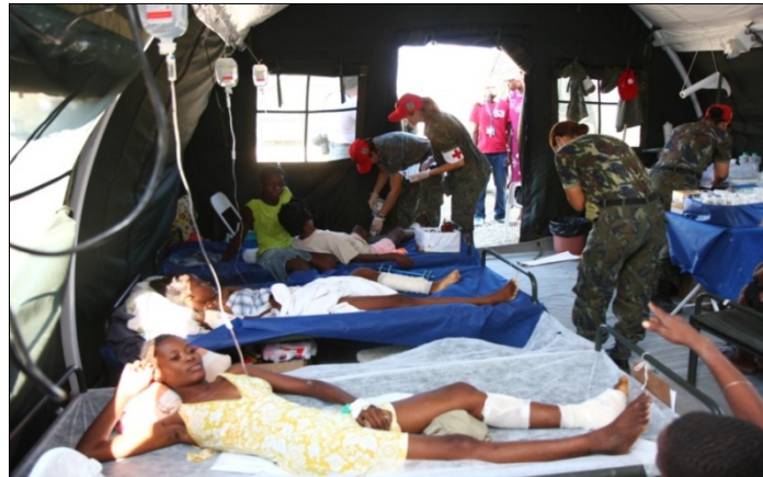
Hospital de Campaña de La FAB – movilización en 48 horas

La Marina de Brasil (MB) movilizó sus navíos anfibios y realizó cuatro viajes a Haití, aportando, también, un gran volumen de donaciones de las más diversas naturalezas. La capacidad anfibia de desembarcar vehículos y carga sin la total dependencia de un atracadero tradicional fue determinante en esta primera fase.