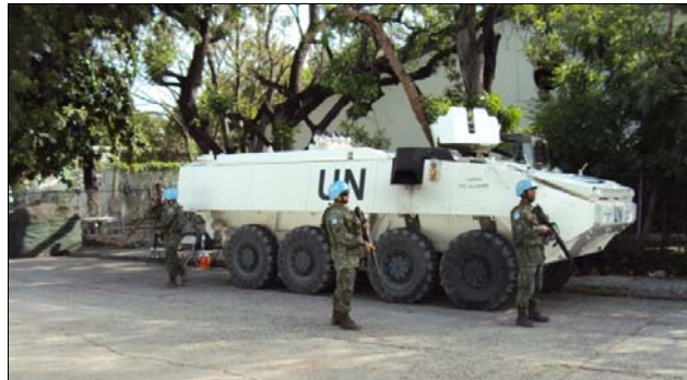
Infantes de Marina proporcionan seguridad al Centro de Balotaje de Votos

La tercera fase, de reconstrucción, aún se encuentra en pleno curso, no habiendo siquiera previsión de su término. Conforme ya mencionado, el MRE, principal actor gubernamental brasileño en esta fase, por intermedio de su Agencia Brasileña de Cooperación, ya logró algunos éxitos en la búsqueda de compromiso de la comunidad internacional con la reconstrucción de Haití. El titular de la carpeta, Ministro Celso Amorim, no ha medido esfuerzos para motivar todos los países, dentro de sus posibilidades, que realicen substanciales donaciones para la causa en cuestión. Releva citar, específicamente, la Conferencia de Donantes, realizada el día 31 de marzo, en Nueva York, cuando fue creado el Fondo de Reconstrucción de Haití, para lo cual Brasil, primero país contribuyente, arribó recursos en el valor de US$ 55 millones.