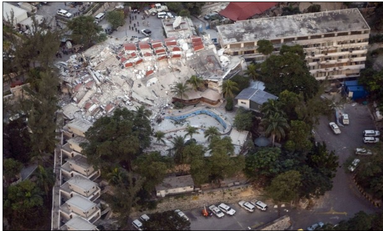
Hotel Christopher – cuartel-general de la MINUSTAH