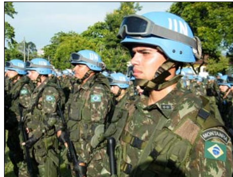
Más 900 militares brasileños para la MINUSTAH

En la segunda fase, merece destaque el incremento del contingente brasileño en la MINUSTAH. Con la venia del Consejo de Seguridad de la ONU, la misión fue autorizada a recibir un aumento de hasta 2.000 militares y 1.500 policiales. Brasil recibió una consulta acerca de la posibilidad de enviar un efectivo adicional de 900 militares, rápidamente acepta. En una cuestión de días, ese personal adicional fue enviado a Haití y el contingente brasileño fue reorganizado, pasando a contar con dos batallones de infantería (BRABATT-1 y BRABATT-2) y una Compañía de Ingeniería (BRAENGCOY), esa última ya insertada en la misión hace algunos años. De ese modo, más de 2.200 militares brasileños, pertenecientes a las tres Fuerzas, integran la misión en el presente.