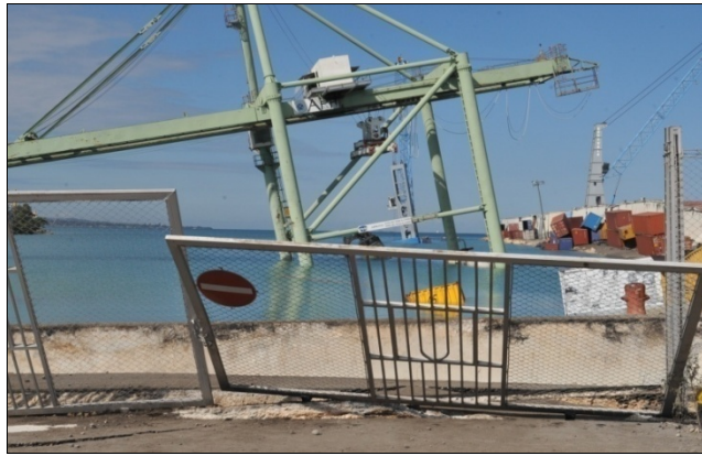
Puerto Príncipe – atracadero principal destruido y hundido