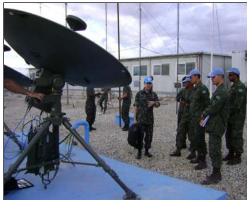
SISCOMIS – garantía de la capacidad de comando y control aún en las condiciones más críticas

evento, trabajaron, durante un buen tiempo, con una demanda muy superior a la esperada y, por lo tanto, en condición de sobrecarga y atasco. De uso exclusivo de la defensa brasileña y, bajo autorización especial, de otros órganos gubernamentales brasileños, el sistema nos permitió, gracias a sus atributos intrínsecos de disponibilidad, integridad, confidencialidad y autenticidad, ejercer una eficaz coordinación del empleo del poder militar brasileño a partir del COC, así como sirvió de “infovia” para otros sistemas brasileños puestos en operación para incrementar la prestación de la ayuda humanitaria, como, por ejemplo, el anteriormente citado portal de donaciones. También permitió la realización de videoconferencias en régimen prácticamente diario con Haití, lo que se reveló una herramienta de valor inestimable para la coordinación de esfuerzos, tanto los puramente militares cuanto aquellos denominados “inter-agencias”.