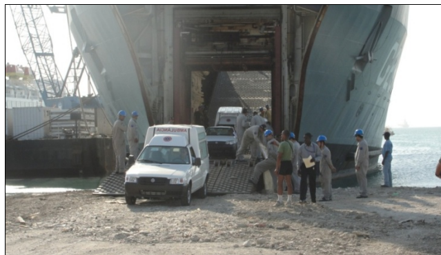
Buque de Desembarco de Tanques Garcia D'Ávila vara en Puerto Príncipe y desembarca ambulancias donadas por Brasil al Gobierno de Haití

A MB aún embarcó personal médico y un destacamento aéreo (personal y dos helicópteros) en el navío-aeródromo italiano Cavour, acompañados de médicos del cuadro permanente de MS, en un notable evento de cooperación internacional, que se sumó a todo el esfuerzo médico que ya venía siendo realizado en tierra por los hospitales de campaña de diversas procedencias.