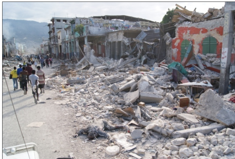
Puerto Príncipe – ciudad devastada

Según las estimativas oficiales, el terremoto dejó aproximadamente 222.570 muertos, 300.000 heridos, 1.300.000 personas desamparadas. Más de 100.000 residencias fueron destruidas y otras 200.000 fueron seriamente afectadas. Aún hoy, las principales plazas públicas y terrenos no-edificados de Puerto Príncipe fueron transformados en grandes campamentos, con diferentes grados de organización, seguridad y saneamiento.