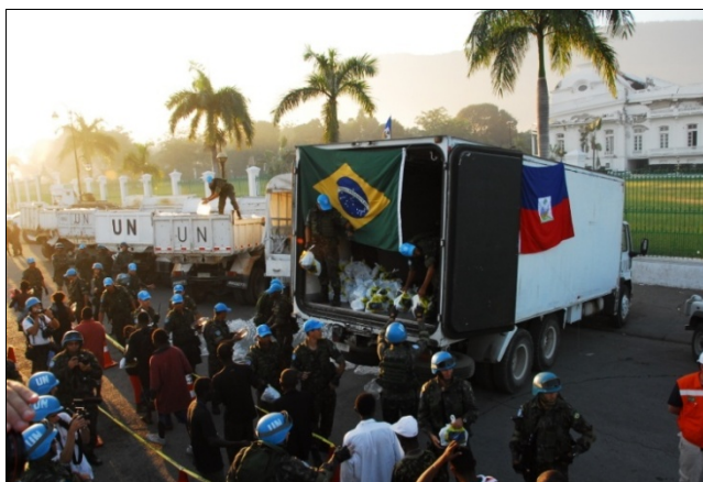
BRABATT – sinónimo de esperanza

MINUSTAH ya había sido recompuesta, reabastecida y recolocada en su condición de plenitud operacional que, a bien de la verdad, jamás llegó a perder. El conocido BRABATT (Brazilian Battalion), que también incluye un Agrupamiento Operativo de Infantería de Marina de la MB, desde los momentos que siguieron al temblor y aún con las bajas sufridas, pasó a prestar un inestimable auxilio humanitario, dentro de sus posibilidades. Esta actividad, desarrollada en paralelo con sus atribuciones principales como componente militar de la MINUSTAH, fue creciendo exponencialmente y transformaron el BRABATT en el principal agente de aplicación de la ayuda humanitaria procedente de Brasil.