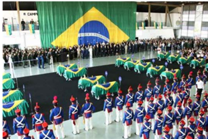
Brasília – Funerales de los militares brasileños fallecidos

El atracadero principal del puerto de la capital fue completamente destruido y el aeropuerto internacional Toussaint Louverture, aún teniendo su pista y patios preservados de mayores daños, también entró en colapso, pues fueron perdidos todos los elementos materiales que permitían el ejercicio del control del tráfico aéreo en el aeródromo. Estos dos factores combinados vinieron a configurarse como grandioso desafío logístico a exigir aún más de nuestros atributos militares.